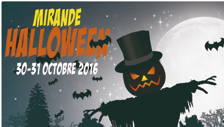
Le grand rendez-vous d'Halloween

La sous préfecture plongée dans l'étrange