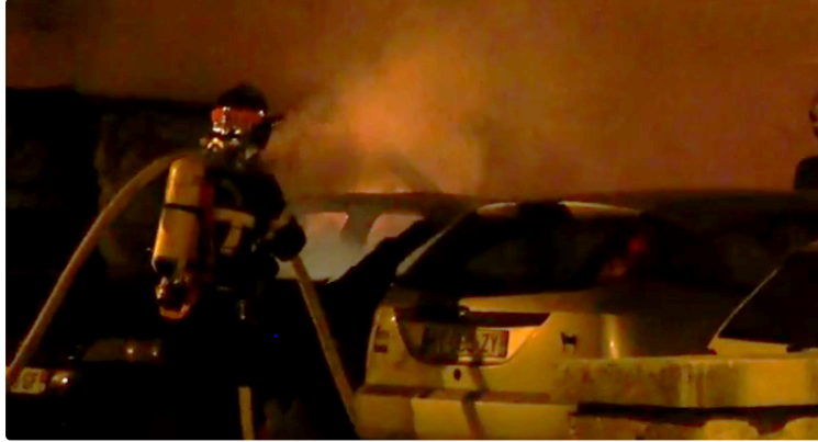
Incendie criminel a condom

Ce sont des riverains du parking de la rue des Argentiers, qui ont donné l'alerte vers une heure du matin, réveillés par le bruit provoqué par les explosions des véhicules en feu. Aussitôt d'importants moyens ont été déployés par les sapeurs-pompiers qui sont restés mobilisés une partie de la nuit pour venir à bout de ce violent incendie et éviter toute reprise.