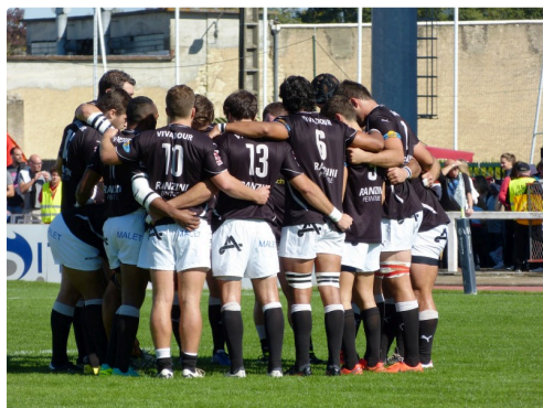
Regroupement d'avant match, dernières consignes.

Cliquez ici pour voir l'entrée des joueurs sur le terrain.