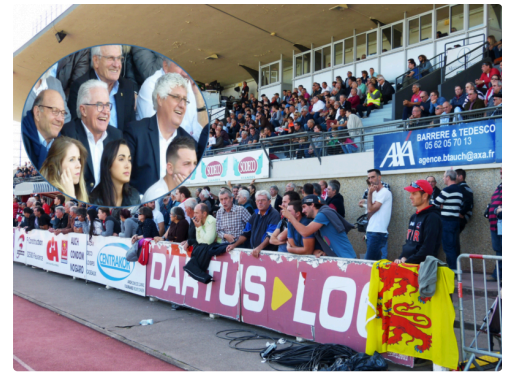
la tribune officielle bien garnie, Belle humeur chez les officiels !