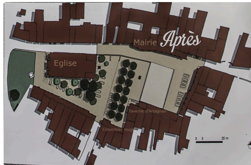
Le projet d'aménagement