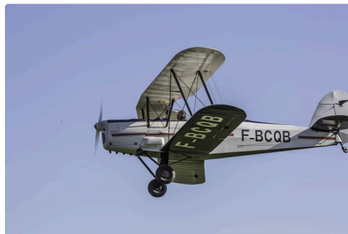
Un Stampe SV 4