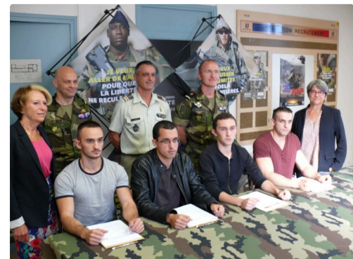
Les quatre engagés entourés des maires de Beaucaire et Saint-Germier, et l'encadrement militaire.