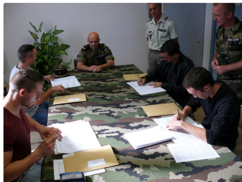
Le moment de la signature des contrats.