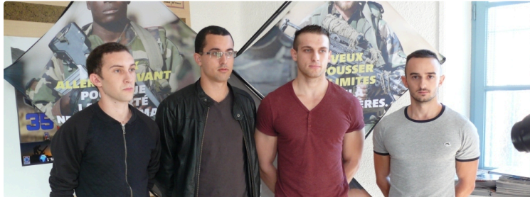
Quatre jeunes citoyens se sont engagés à servir la France

Ils ont signé leur contrat lundi 3 octobre au Centre d'information et de recrutement des forces armées du Gers à Auch