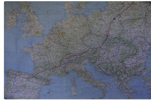
L'itinéraire complet (6 000 km)