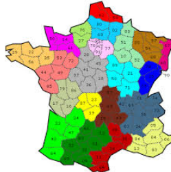
Les nouvelles régions de France

Le journal officiel a publié ce jeudi 29 septembre le décret qui fixe le nom et le chef lieu des nouvelles régions françaises.