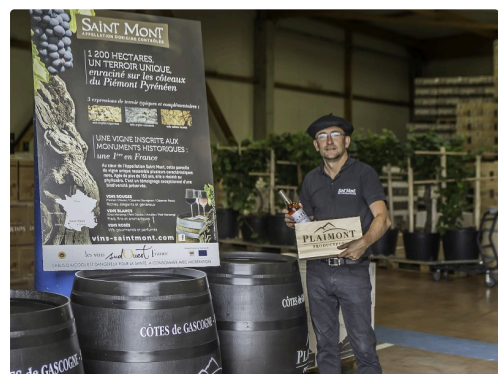
Accueil au chai d'expédition

On pouvait y acheter des vins habituellement en vente dans les grandes surfaces et les cafés-hôtels-restaurants. Mais on pouvait aussi y trouver un des meilleurs crus du terroir, le Monastère.