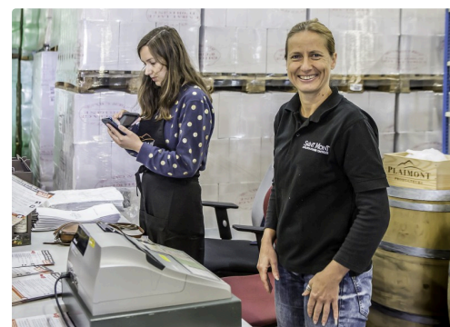
Le service marketing est à pied d'œuvre