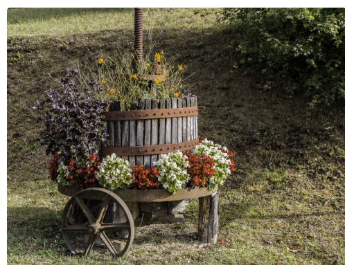
Vu à proximité de la Cave Saint-Mont