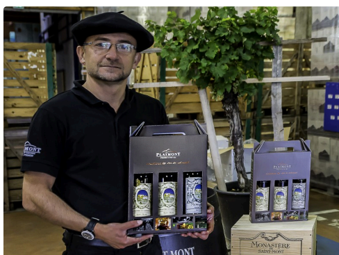
Le Monastère est en vente