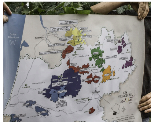
Éric Fitan déploie la carte des vins Sud Ouest France où l'on voit que le vignoble suit le chemin de Saint-Jacques-de-Compostelle