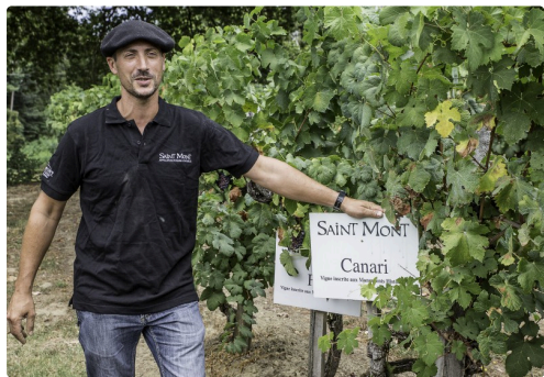
Un des cépages retrouvés