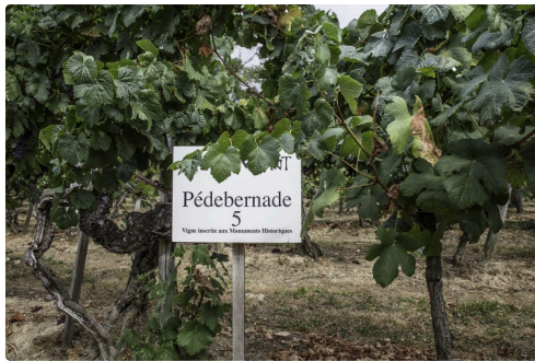
Deux autres pieds conduits sur hautain