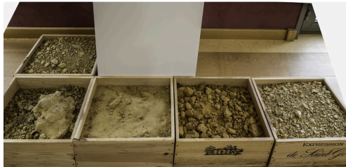
Les terrains du Saint Mont