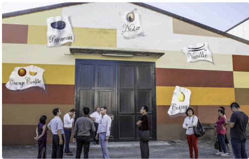
Les visiteurs apprécient la décoration du chai avant d'y entrer