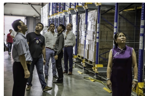
Dans le hangar de stockage automatisé du vin et du floc