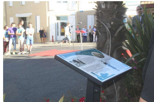
Le Pupitre explique le drame survenu en ce lieu.

Samedi matin, 6 août, à côté de la mairie, face à ce qu'était en 1944 l'Hôtel Lafontan, en présence des autorités civiles et militaires, d'anciens combattants et des habitants de la commune, madame la Ministre de l'Education Nationale, de l'Enseignement Supérieur et de la Recherche, Najat Vallaud-Belkacem a inauguré le Parcours de Mémoire du 6 août 1944. La cérémonie s'est prolongée à Toujouse, au bois de Bascaules, devant le monument des trois jeunes fusillés par les allemands.