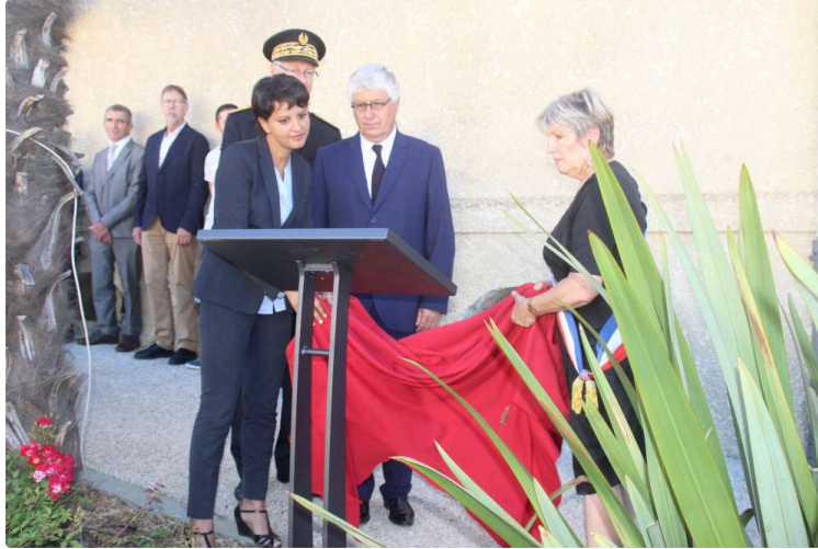
Le Houga : Najat Vallaud-Belkacem a inauguré le Parcours de Mémoire

Samedi matin, 6 août, à côté de la mairie, face à ce qu'était en 1944 l'Hôtel Lafontan, en présence des autorités civiles et militaires, d'anciens combattants et des habitants de la commune, madame la Ministre de l'Education Nationale, de l'Enseignement Supérieur et de la Recherche, Najat Vallaud-Belkacem a inauguré le Parcours de Mémoire du 6 août 1944. La cérémonie s'est prolongée à Toujouse, au bois de Bascaules, devant le monument des trois jeunes fusillés par les allemands.