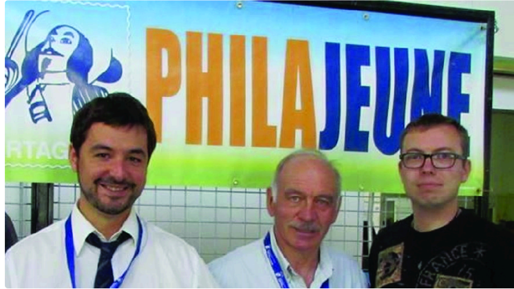
Avis aux philatélistes de tous ages

Philajeune, association philatélique créée voilà bientôt 30 ans, participe une nouvelle fois à l'animation du festival de BD à Eauze le 7 août prochain. Seize années de présence à Eauze, avec un souvenir philatélique nouveau chaque année.