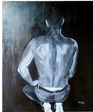
Salles-d'Armagnac – Des toiles de Francis Tuella au château

Des œuvres puissantes que l'on n'oublie pas