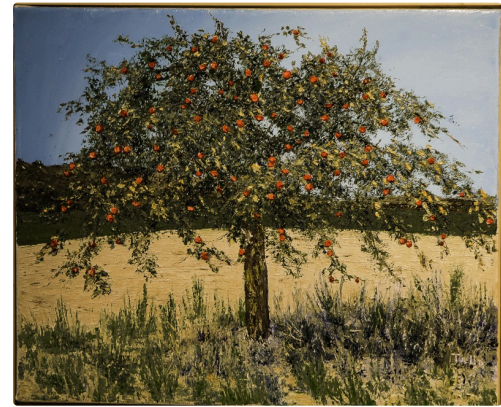
3 Tableau Francis Tuella 1bis 070716.jpg