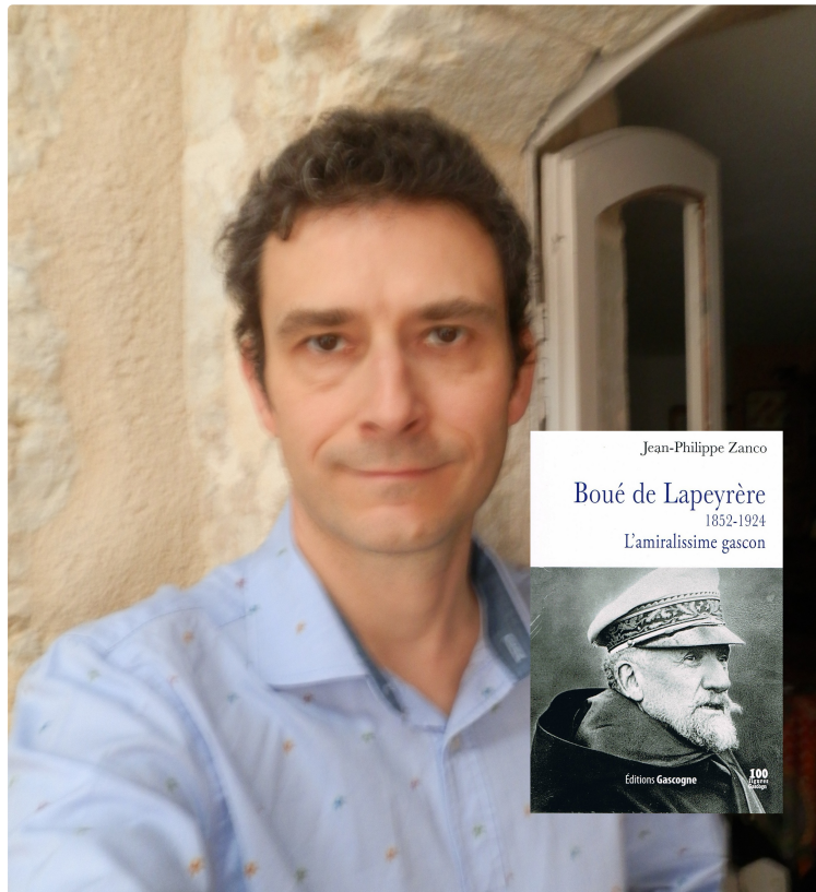
Le Gers une terre de marins ?

L'amiral Boué de Lapeyrère, natif de Castéra-Lectourois, en est un