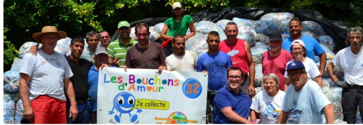
Les Bouchons d'Amour : 11 tonnes de bouchons plastiques expédiés en Belgique