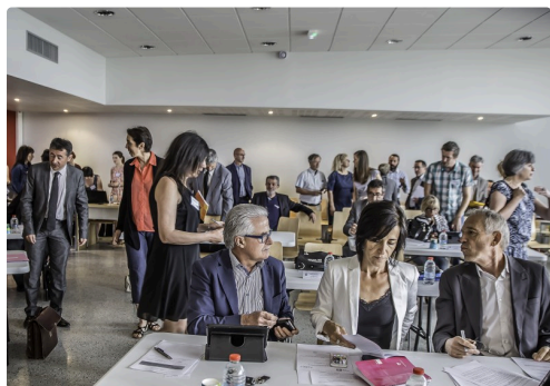
Le Conseil départemental s'installe