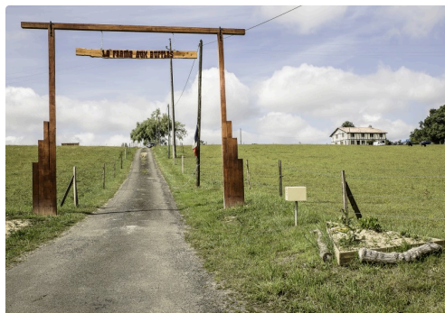
L'entrée : en haut à droite, la ferme auberge

(1) D'après le site : ( http://www.bioactualites.ch/fr/production-animale/bovins/vaches-laitieres/wasserbueffel.html ). (2) Lieu-dit Lectoure 32290 Aignan (voir l'itinéraire ci-dessous) Tél. : 06 29 28 31 53 ; courriel : lafermeauxbuffles@orange.fr