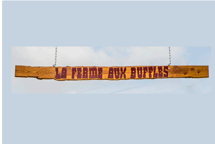
Aignan : la Ferme aux buffles va ouvrir une auberge dans un site superbe

Avec buffles, âne, cochon et chèvres naines, oies et lapins