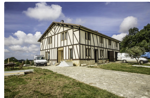
La ferme auberge