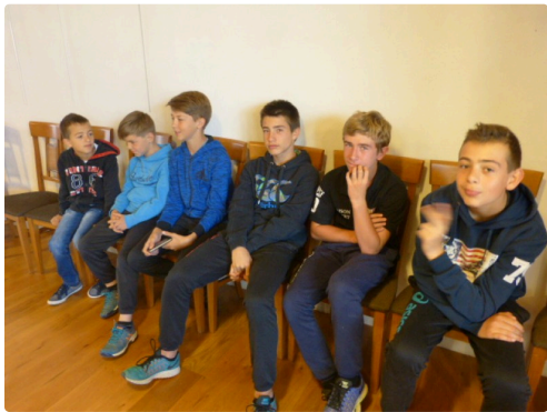
les jeunes espoirs du rugby