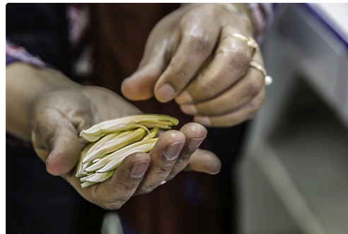
Les bébés bananes dans les mains de Nadia