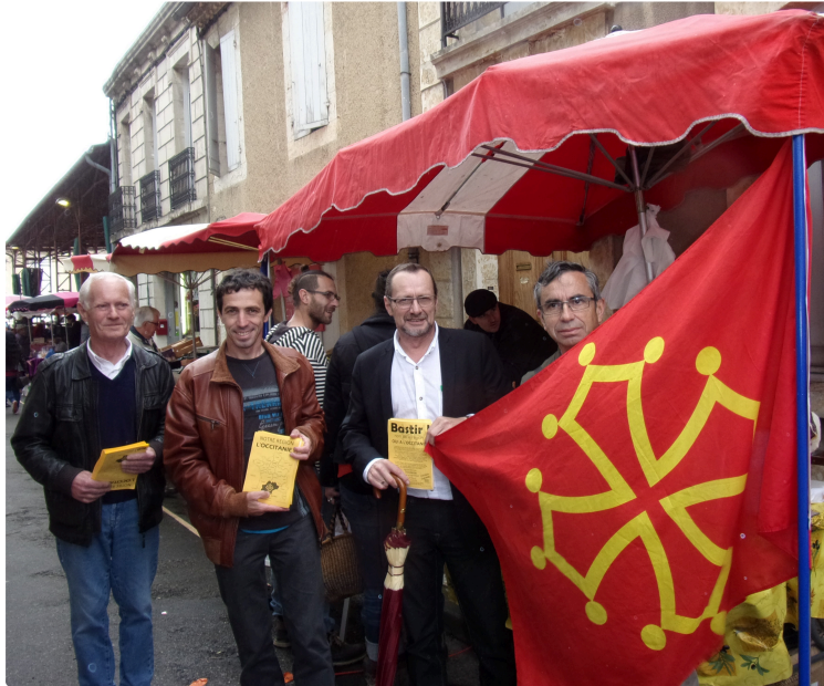
Bastir à Auch : OCCITANIE !

L'Accueil des Auscitains a été particulièrement enthousiaste