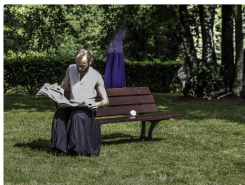
Le spectacle commence. l'artiste est cachée derrière un arbre