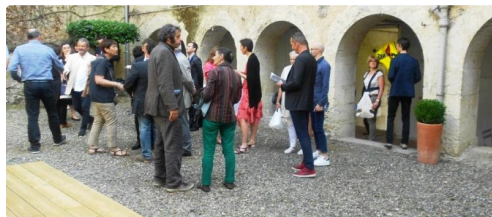
Le public se presse autour des arcades

A visiter absolument pour la magie des lieux et la particularité de l'expo, de plus le cloître intérieur est un espace de pause et détente, relié au WIFI, doté de distributeurs de boissons et en-cas.