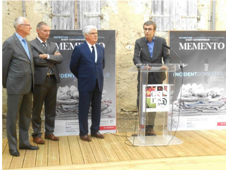
Memento: un lieu d'Histoire et de transition

Première expo d'art contemporain avec "Incident domestique"