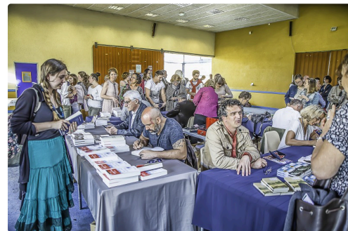
1 Dédicaces 1bis 200516.jpg