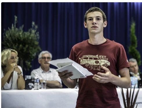
Présentation d'un ouvrage