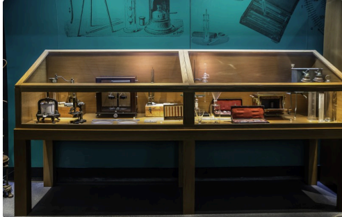
9 Vitrine 1bis 070516.jpg