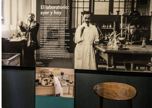
10 Mur labo 1bis 070516.jpg