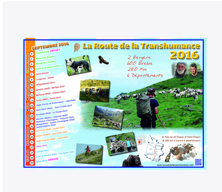
À Toujouse on prépare le parcours de la transhumance

En septembre les 600 brebis quitteront leur estive des Pyrénées