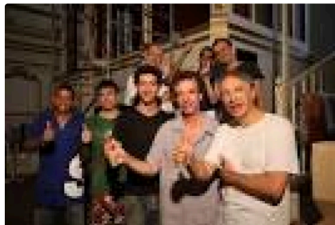
2 Avec les "Facteurs " à Rio