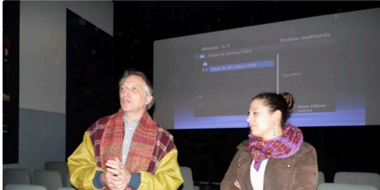
La construction de l'Orgue de Rio

La chaîne K T O rediffuse le film de Marika Julien