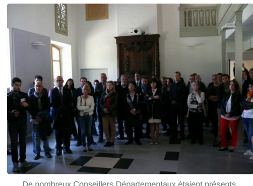
De nombreux Conseillers Départementaux étaient présents.