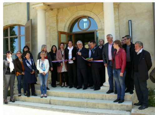
Le ruban tricolore coupé ouvre la porte à la "Cité de la transition énergétique".

Des locaux qui seront occupés au premier étage par les associations, Arbres et paysages, CAUE, et le GAAB 32, alors que le rez-de-chaussée sera dédié à l'accueil de séminaires, colloques, formations, et expositions.