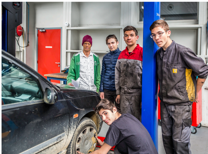
Semaine de la persévérance scolaire à la cité scolaire de Nogaro

Les 2es bac pro ont relevé des défis et pris les choses en main