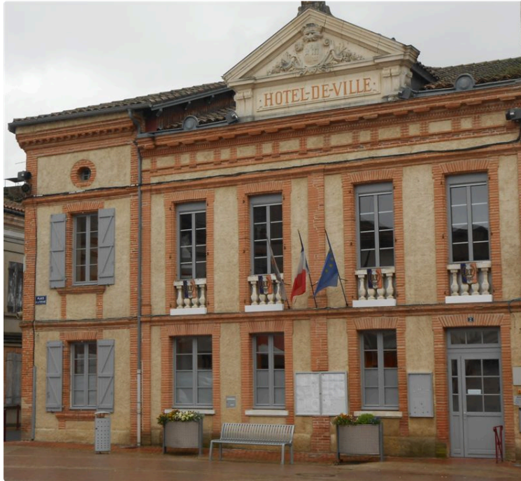
SAMATAN Conseil Municipal