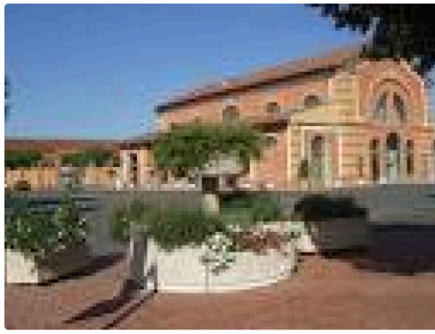
téléchargement (4) - Copie.jpg

Logo-Samatan-2015-ver-coul-500x500 (2).jpg