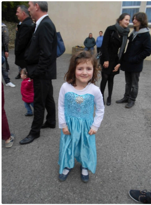
Reine des Neiges pour une soirée ....c'est exaltant.