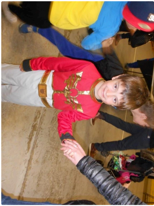
Les powers rangers en vrai