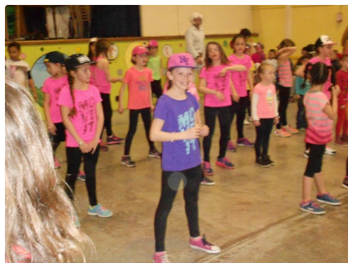
En place pour le spectacle