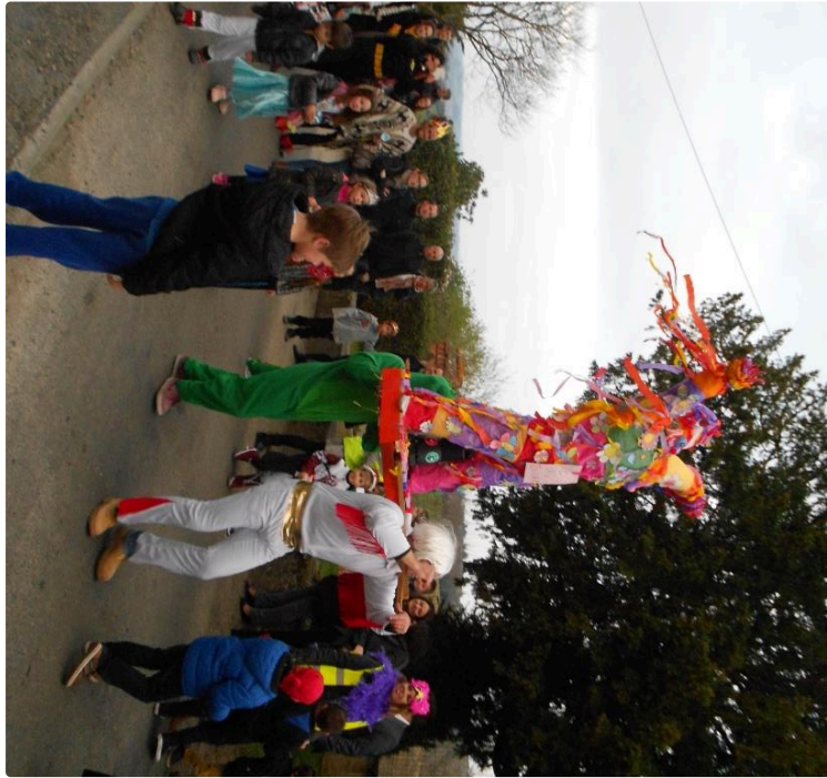
Carnaval à l'école

Soirée festive pour l'école Castin Duran