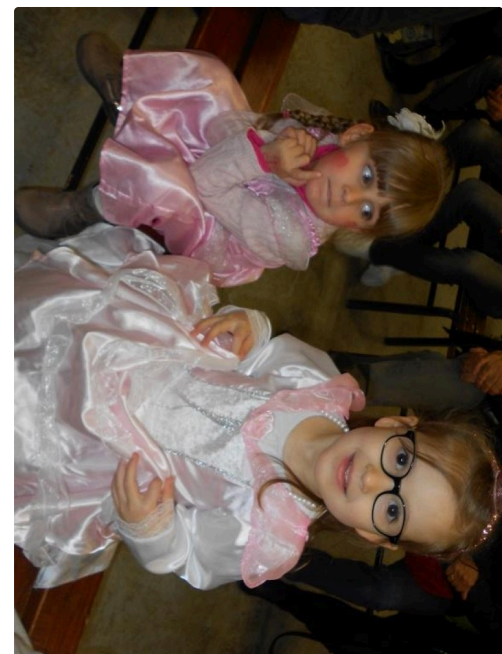
Reine et princesse ?