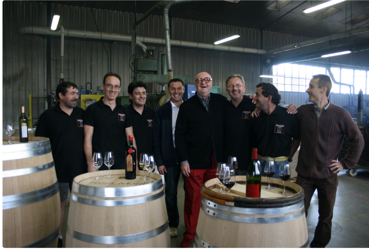
Jean-Pierre Coffe le premier parrain du Saint-Mont en fêtes est décédé

Il avait particulièrement apprécié Plaisance