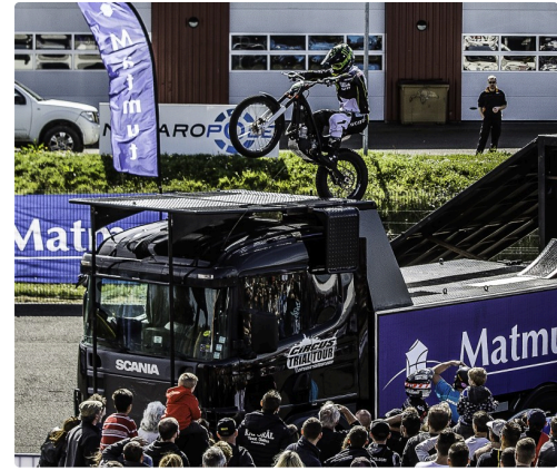
Les acrobaties en cyclomoteur ont attiré du monde