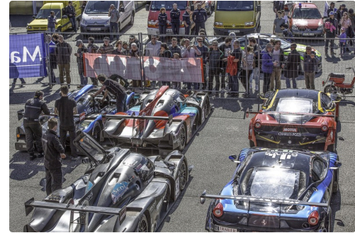
Les GT/Prototypes FFSA ont eu beaucoup d'admirateurs au parking