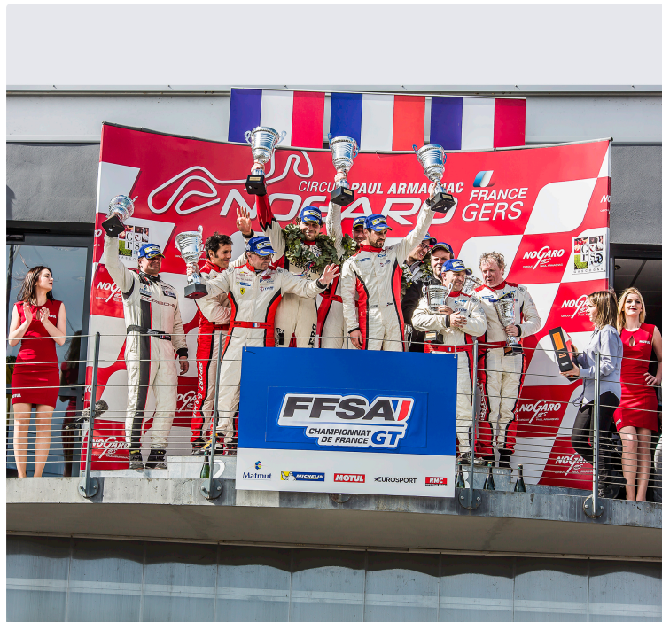
La grande fête de l'auto pour Pâques au circuit de Nogaro

Une fête populaire avec des courses et d'autres spectacles