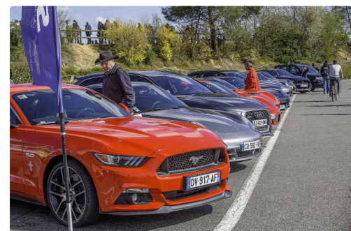
Un alignement de voitures de rêve ...