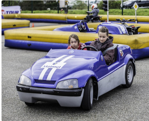
Les enfants ont pu rouler sans danger