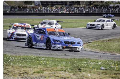
Début de la course 2 des Supertourisme