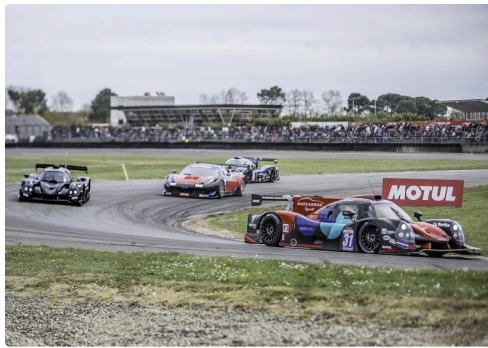
Course 2 des GT/Prototypes