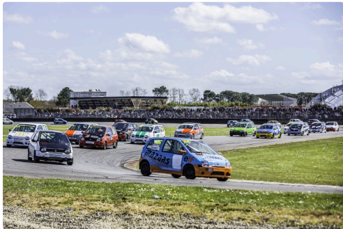
Départ de la course 3 des Twin Cup B