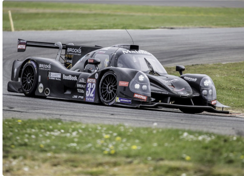
Course 2 des GT/Proptotypes