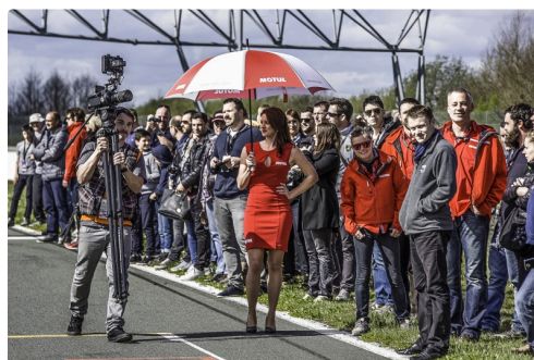
Les spectateurs ont pu voir les stars de GT/Prototypes sur la piste avant le départ des 2 courses