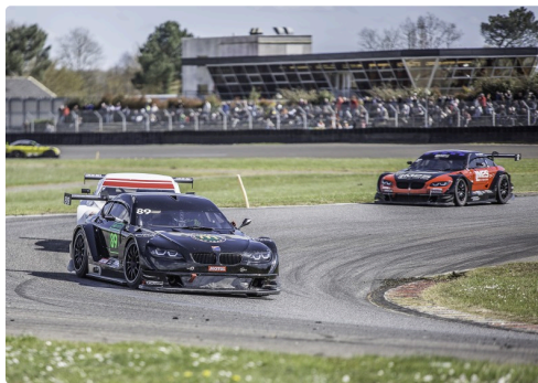
Dans le "peloton" de la course 2 Supertourisme