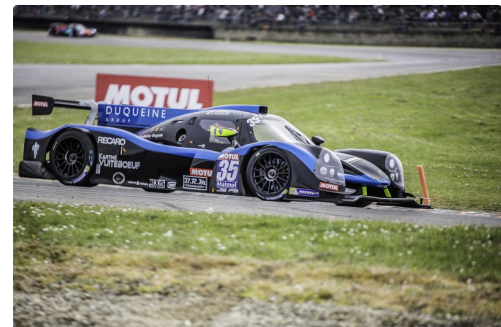
Course 2 des GT/Prototypes