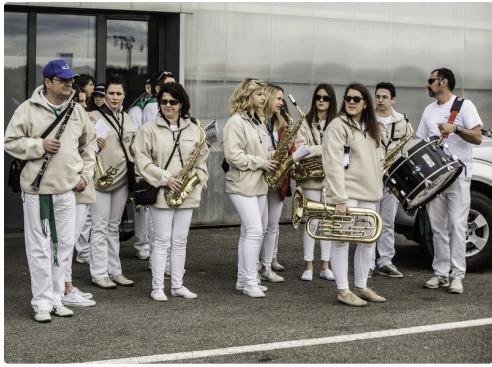
Les Dandy's, la banda d'Aignan, vient animer la pause du déjeuner