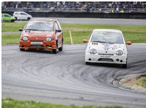
La tête de la course 4 Twin Cup A