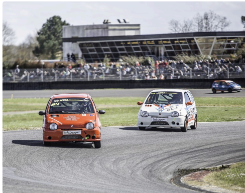
Tête de la course 3 des Twin Cup B