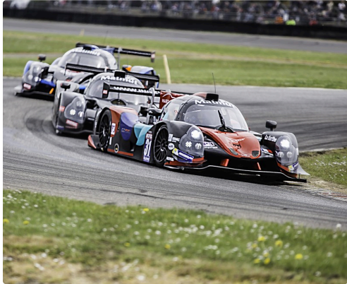
Course 2 des GT/Prototypes