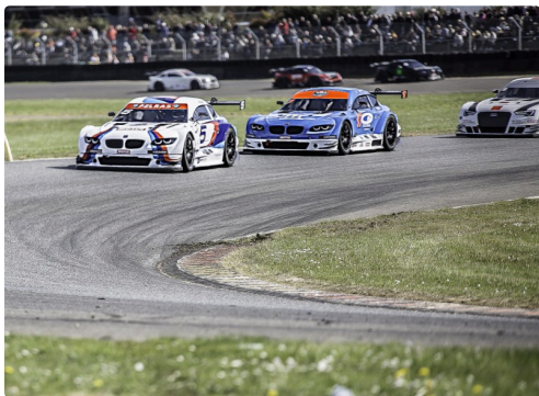
Fin de la course 2 des Supertourisme