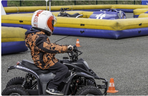
Les jeunes motards étaient comblés