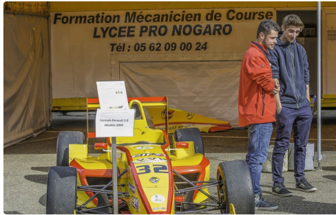
Le cours de mécano de compétition du lycée d'Aignan est venu avec ses Formula Renault