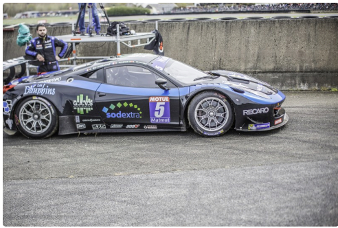
En panne dans la course 2 des GT/Prototypes