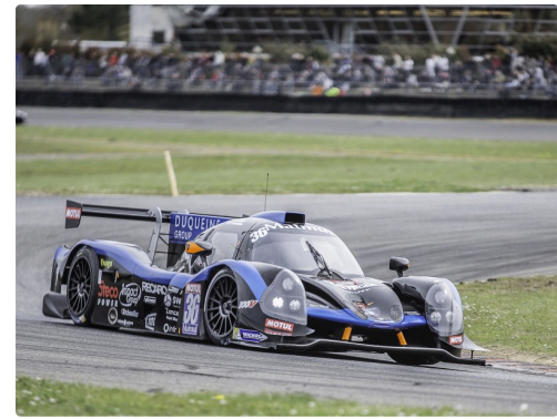
Course 2 des GT/Prototypes