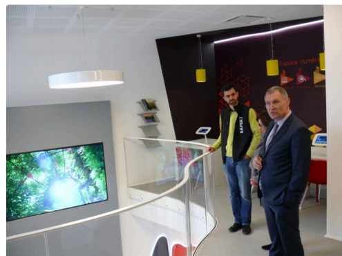
L'espace branché du 1er étage.