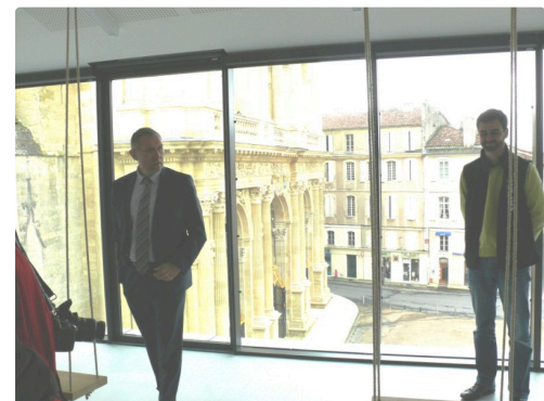
Au 3ème étage vue magnifique sur la cathédrale.