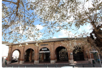
L'ISLE-JOURDAIN / Activités culturelles non-stop