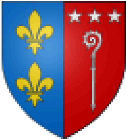
65px-Blason_ville_fr_Simorre_(Gers).svg - Copie.png