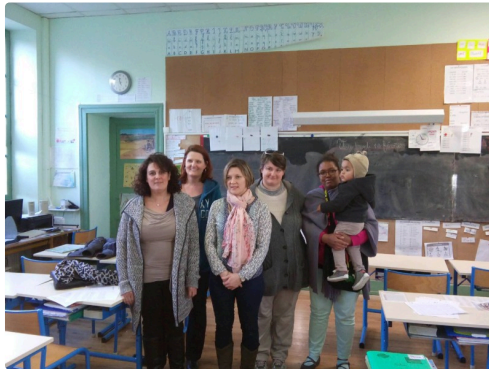
L'équipe des parents élus du conseil d'école, ont appelé au rassemblement dès vendredi pour informer les parents de la proposition "inacceptable et incompréhensible" de suppression de classe et de poste imposée par la Directrice d'Académie.