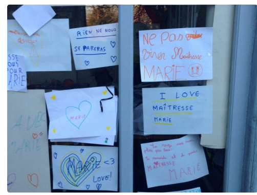
La garderie aussi...