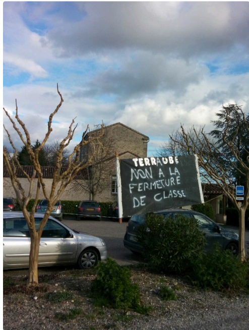
Les panneaux d'information sont mis en place.

http://www.petitions24.net/fermeture_dune_classe_ecole_terraube