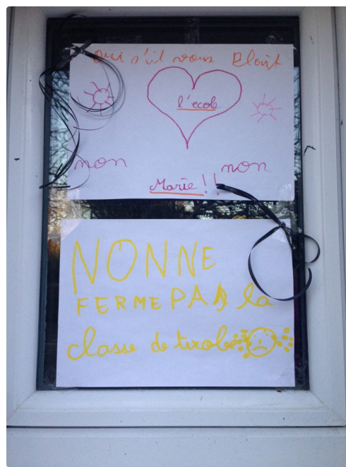
Jusqu'aux fenêtres, tous les espaces ont été occupés par les enfants.