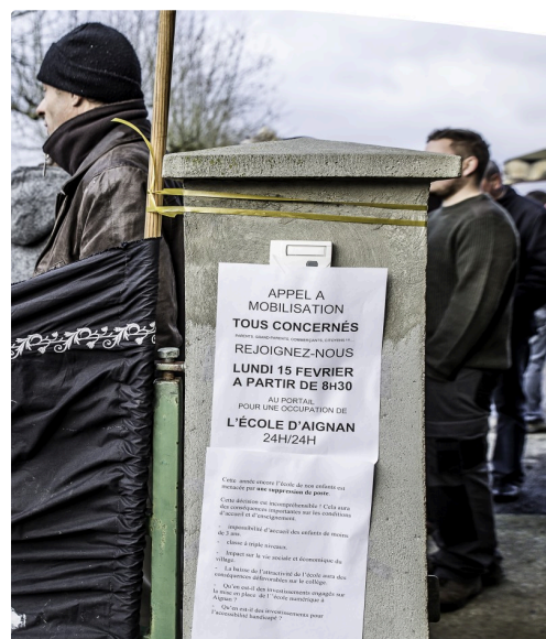
L'appel à la mobilisation est placardé sur l'entrée de l'école

Il est clair que cette argumentation ne saurait plaire aux maires des communes dont les écoles font partie d'un RPI. Le Journal du Gers demandera leur avis à des maires concernés dès que possible.