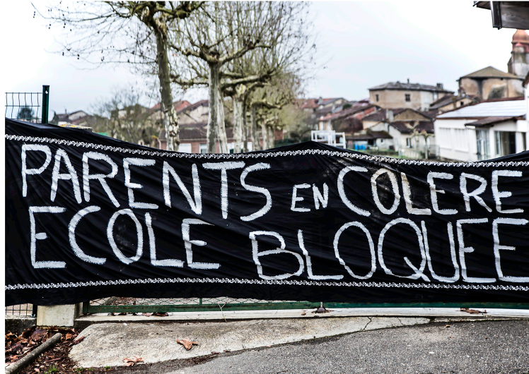
L'école d'Aignan bloquée par les parents et les élus

Mobilisés contre la suppression d'un poste d'enseignant