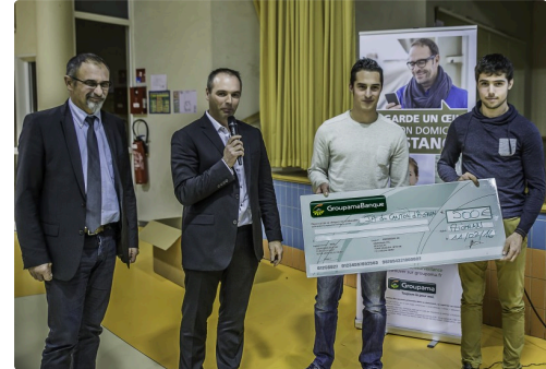
Remise d'un chèque à de jeunes viticulteurs