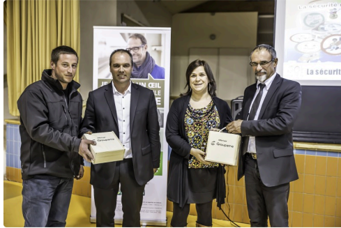
Remise des jeux éducatifs à des parents d'élèves