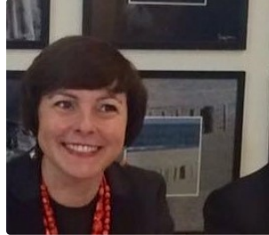
Quel sera le nouveau nom de notre région ?

Bientôt une "Consultation Citoyenne" promise par Carole Delga sur le nom de la région