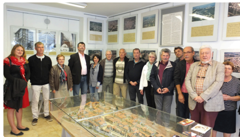
L'exposition sur les centres de peuplement au 20 Grande rue est une réalisation des Motivés.