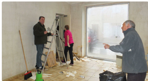
Les Motivés ont aménagé de nombreux locaux.