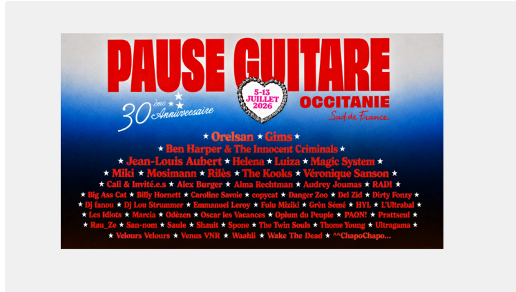
Pause Guitare : une soirée du 10 juillet entre légendes et rock international