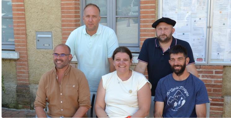
Soirées gourmandes 2026 : retrouver l'esprit d'antan