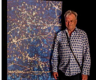
Exposition : Antoine Poupel – Photographies / Peindre la lumière