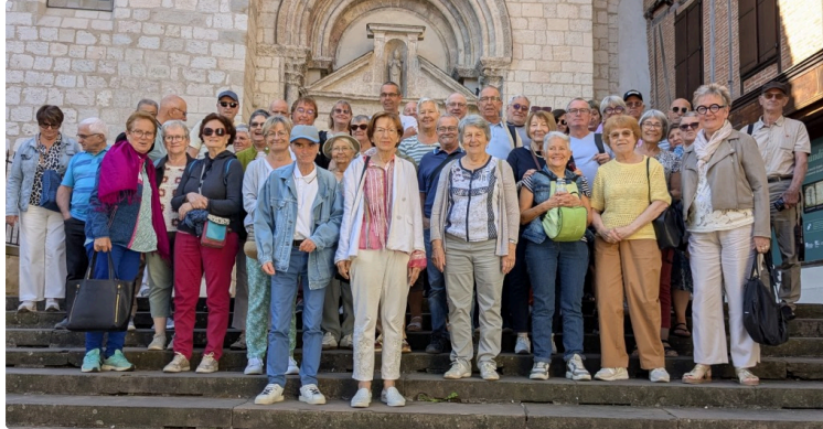
Une belle journée quasi estivale conjuguant culture et bonne chère, à Albi avec l'ASPAD

Ce dernier vendredi ,tous les ingrédients étaient réunis pour la réussite de ce petit voyage à Albi organisé par l'ASPAD