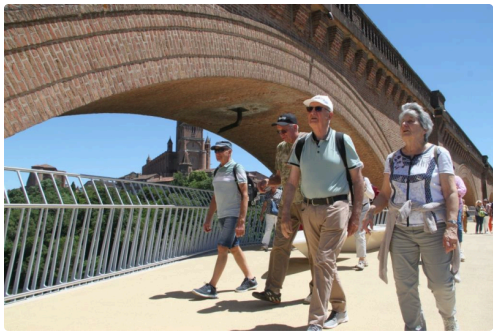
La nouvelle passerelle