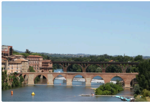
le vieux pont