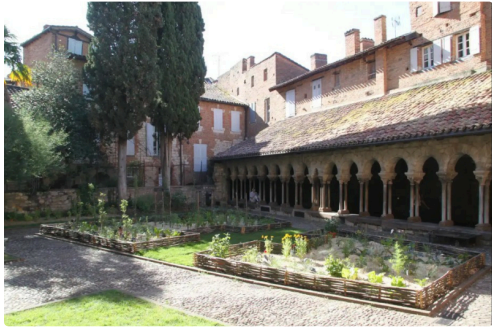
cloître St Salvi