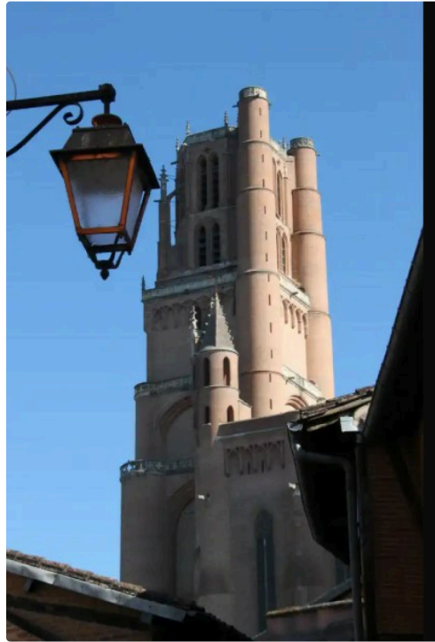
cathédrale Ste Cécile