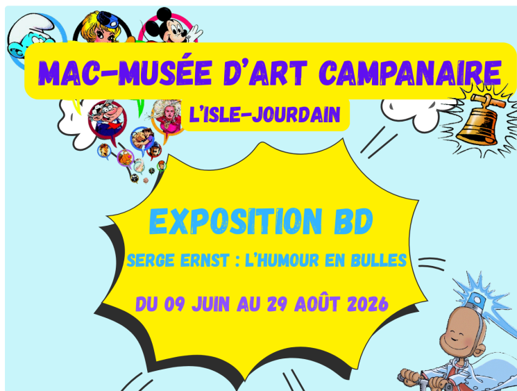
Serge ERNST : l'humour en bulles s'invite au musée d'Art Campanaire

Le Musée d'Art Campanaire de L'Isle-Jourdain accueille du 9 juin au 29 août 2026 une exposition exceptionnelle consacrée au dessinateur de bande dessinée Serge Ernst, figure incontournable de l'humour graphique.