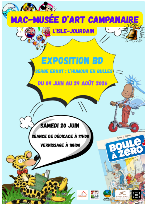
Affiche Exposition BD SERGE ERNST l'humour en bulles. MAC-Musée d'Art Campanaire. été 2026.png