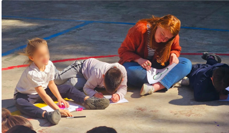
Scampia : quand le service devient rencontre

Participer au projet SEMIL et partir à Scampia, dans cette « école de la deuxième chance » qu'est CasArcobaleno, a profondément marqué chacun d'entre nous. Derrière ce voyage solidaire, il y avait des mois de préparation, mais surtout une envie commune : aller à la rencontre de l'autre, apprendre autrement et se mettre au service des plus démunis.