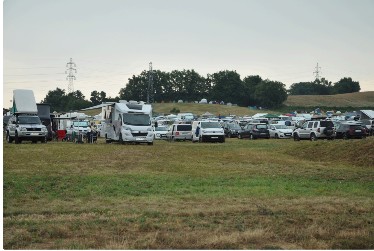
Tempo Latino 2026 du 30 juillet au 2 août : où dormir ?

Que vous veniez en tente, en van ou que vous cherchiez un lit douillet, plusieurs solutions s'offrent à vous pour loger à Vic-Fezensac pendant le festival.