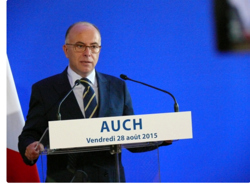
Bernard Cazeneuve: « La République, c'est la laïcité ».