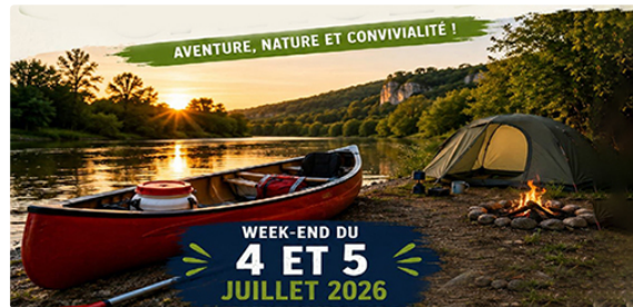
Grosses chaleurs ! envie de fraîcheur ?